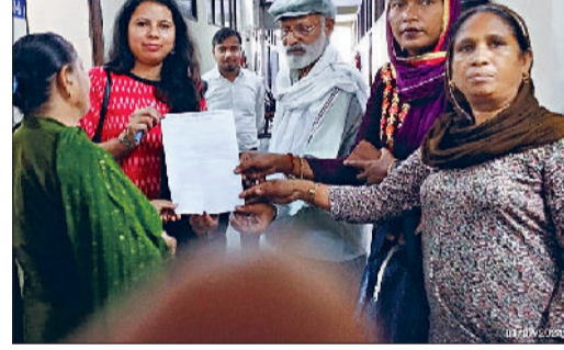
सोनीपत। सीटीएम को ज्ञापन सौंपते मिड-डे मील कार्यकर्ता।