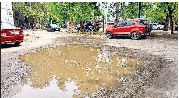
सोनीपत। परिसर में अलग-अलग सड़क मार्ग पर बने गड्डे।

जिले के नागरिक अस्पताल में आने वाले मरीजों को परेशानी का सामना करना पड़ रहा है। आपातकालीन कक्ष के सामने वाली सड़क छोड़कर अस्पताल परिसर के अन्य रास्ते गड्डों में तबदील हो चुके हैं। दो दिन से रूक-रूककर हुई बारिश से गड्डों में पानी भर गया है। परिसर में सड़क मार्ग की समस्या नई नहीं है। करीब दो साल से सड़क टूटी पड़ी है। संबंधित विभाग व अस्पताल प्रबंधन की तरफ से सड़क मार्गों की खस्ता हालत पर कोई ध्यान नहीं दिया जा रहा है। पानी से भरे गड्डों में मच्छर का लारवा पनप चुका है। जिससे अस्पताल में उपचार के लिए आने वाले कर्मचारी व मरीज ठीक होने की बजाय बीमार पड़ सकते हैं। बता दें कि नागरिक अस्पताल में हाल के