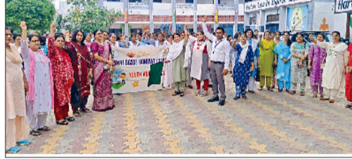
सोनीपत। जागरूकता रैली को रवाना करते प्राचार्या एवं अन्य।