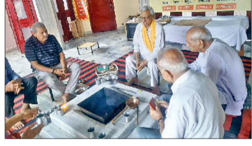
सोनीपत। कार्यक्रम के दौरान हवन करते समिति सदस्य।