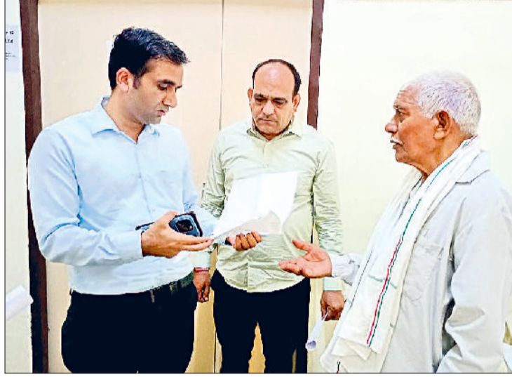
खरखौदा। समाधान शिविर में बुजुर्ग की शिकायत सुनते उपायुक्त।