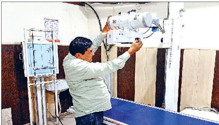
सोनीपत। एक्स-रे मशीन को ठीक करता इंजीनियर।

जिले के नागरिक अस्पताल में कई दिनों से एक्स-रे करवाने का इंतजार कर रहे मरीजों के लिए राहत भरी खबर है। कई दिनों से एक्स-रे विभाग के बाहर मशीन खराब होने का नोटिस चस्पा देकर मरीज वापिस लौट रहे थे। सोमवार को अस्पताल में पहुंची इंजीनियर की टीम को कई घंटों के मेहनत के बाद मशीन ठीक हो गई। जिसके बाद अस्पताल प्रबंधन के साथ-साथ एक्स-रे विभाग में तैनात कर्मचारियों ने राहत की सांस ली है। वहीं बिना एक्स-रे के वापिस लौट रहे मरीजों को परेशानी का सामना नहीं करना पड़ेगा। मंगलवार सुबह से एक्स-रे शुरू हो जायेंगे। बता दें कि नागरिक अस्पताल में योजना 80 से 150 मरीजों के एक्स-रे होते हैं। वर्ष 2007 को बाहर पैसे देकर एक्स-रे करवाने के लिए मजबूर होना पड़ रहा था। अस्पताल प्रबंधन की तरफ से पत्राचार के बाद सोमवार को