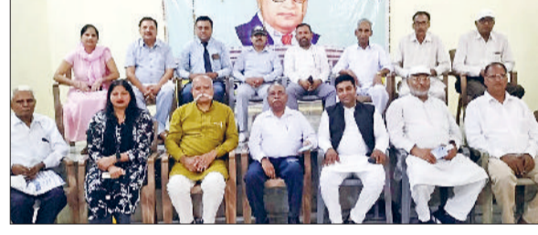
पीपुल्स पार्टी ऑफ इंडिया डेमोक्रेटिक पार्टी की नई कार्यकारिणी का स्वागत करते हुए।