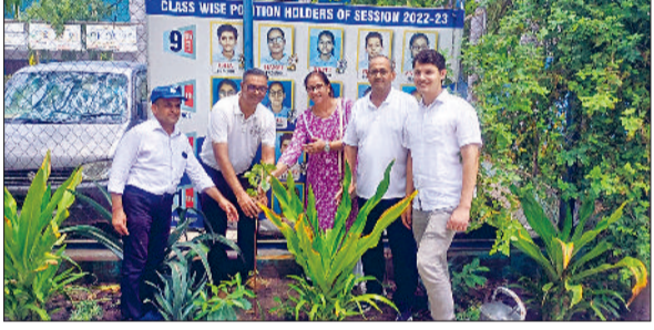
खरखौदा। स्कूल प्रबंधन के साथ पौधारोपण करते काजला दंपति।

सीआइएसएफ के डीआईजी विनय काजला ने खरखौदा के प्रताप स्कूल का दौरा किया और खेल व शैक्षणिक गतिविधियों का निरीक्षण किया। द्रोणाचार्य अवाई ओमप्रकाश दहिया खेल निदेशक प्रताप स्कूल व एकेडमिक डायरेक्टर डॉ. सुबोध दहिया ने बुके भेंट कर उनका स्वागत किया। साथ ही स्कूल में चल रही खेल व शैक्षणिक गतिविधियों से अवगत कराया। डीआईजी ने स्कूल के खिलाड़ियों द्वारा अंतरराष्ट्रीय स्तर पर 229 व राष्ट्रीय स्तर पर 1800 पदकों की सूची को देखकर उन्होंने कहा